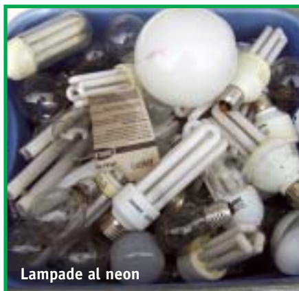
Lampade al neon